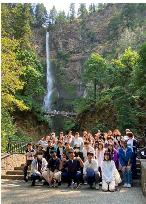
▲マルトノマフォールズ

現地時間朝9時頃、シアトル空港に到着し、バスでオレゴン州ポートランドへ向かいました。途中、マルトノマフォールズに立ち寄り、夕方には宿泊先であるポートランド州立大学の寮に到着しました。