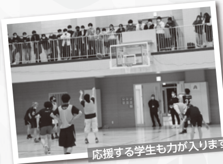
応援する学生も力が入ります