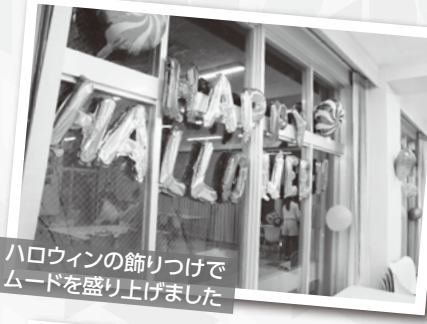
ハロウィンの飾りつけでムードを盛り上げました

クリスマスパーティーの会場となった体育館では、学生による演奏(ピアノ・フルート)や、教職員による演奏(ピアノ・バイオリン・ヴィオラ)もあり、笑顔が溢れた2日間となりました。