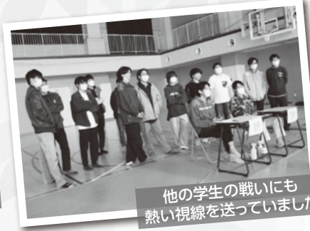
他の学生の戦いにも熱い視線を送っていました