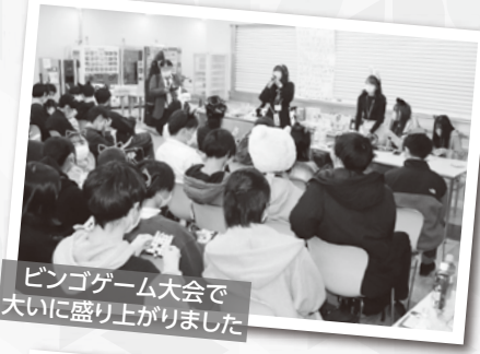
ビンゴゲーム大会で大いに盛り上がりました