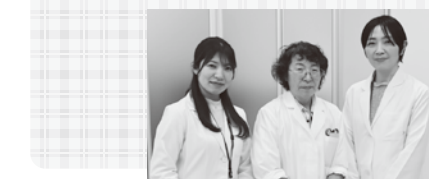
健康管理センター

「国家資格の取得」と「充実した大学生活」の両立を目指し、さまざまな事務局がサポートに努めています。今回は学生課をレポートします。 学生課 学生課の業務は、奨学金に関すること、学生証や各種証明書の発行手続き、課外活動のサポートや、学生生活・健康・メンタルヘルスに関する相談など多岐にわたります。 また、大樹祭をはじめ、シーズンごとの様々なイベントも学生と共に計画し実施しています。 大学生活では、責任やストレスを感じたり、不安に思うこともあると思います。学生課では、学生一人一人の不安にも寄り添いながら、充実した学生生活を送れるようサポートいたします。