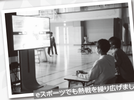
eスポーツでも熱戦を繰り広げました