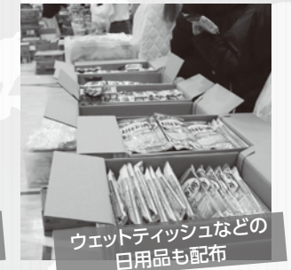
ウェットティッシュなどの日用品も配布