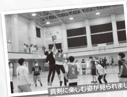
真剣に楽しむ姿が見られました

コロナ禍前のように、参加する学生が増えてきており、学業だけではなく、今だから経験できる多くの機会に触れてもらえるよう、今後も様々なイベントなどを企画していきたいと思ひます。