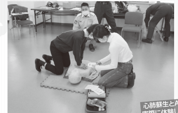
心肺蘇生とAEDを実際に体験しました