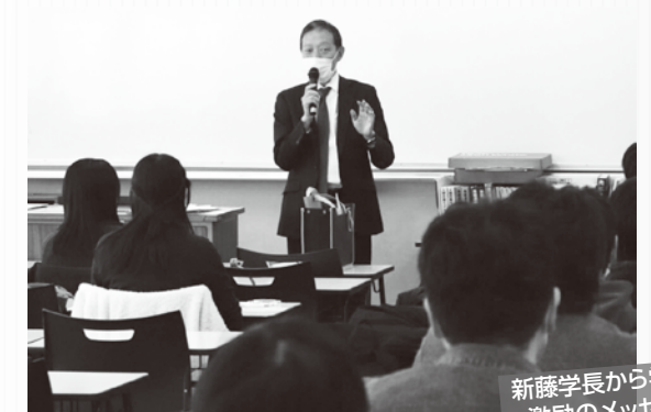
新藤学長から学生へ激励のメッセージ