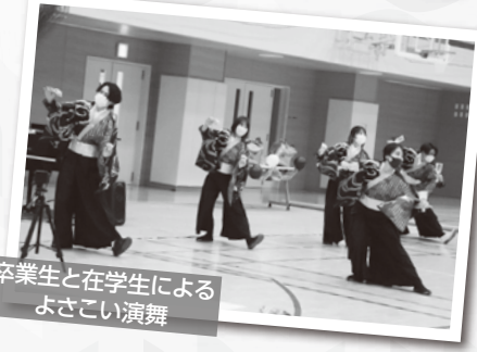
卒業生と在学生によるよさこい演舞