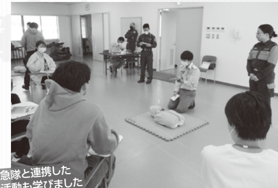
救急隊と連携した救命活動も学びました

本学と埼玉医科大学の学生が合同で普通救命講習を受講しました。西入間広域消防組合消防本部の方が講師となり実際の現場を意識した訓練も行われ、医療従事者をめざす学生にとって有意義なものになり、参加学生には普通救命講習修了証が授与されました。