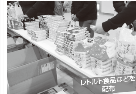
レトルト食品などを配布

受け取った学生からは「食材含めて様々な物価が高くなっているのに、とても嬉しいです」などの喜びの声が聞かれました。